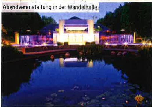
Abendveranstaltung in der Wandelhalle