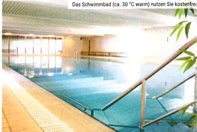
Das Schwimmbad (ca. 30 °C warm) nutzen Sie kostenfrei

Reisetermine und Preise unserer Buspartner (nach PLZ sortiert) entnehmen Sie bitte der Tabelle ab Seite 49.