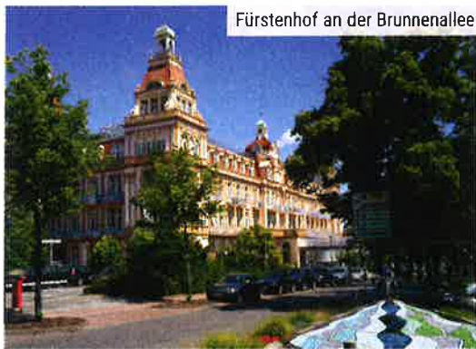
Fürstenhof an der Brunnenallee