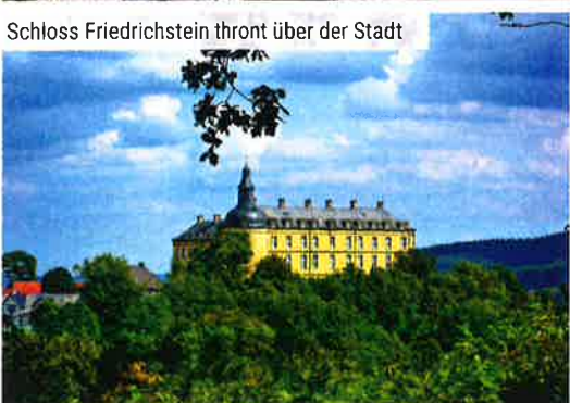
Schloss Friedrichstein thront über der Stadt