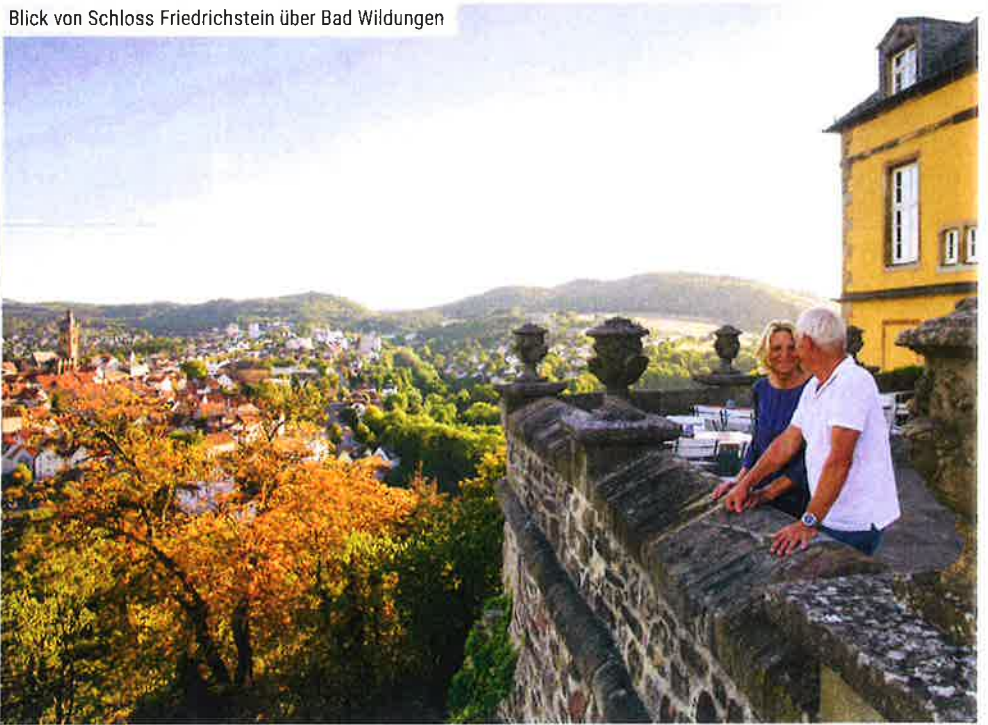
Blick von Schloss Friedrichstein über Bad Wildungen